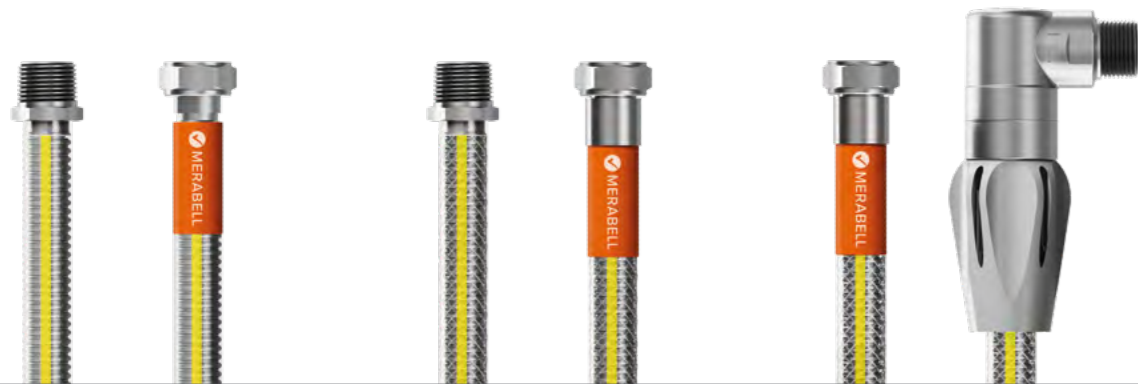
CELONEREZOVÁ HADICE CLASSIC